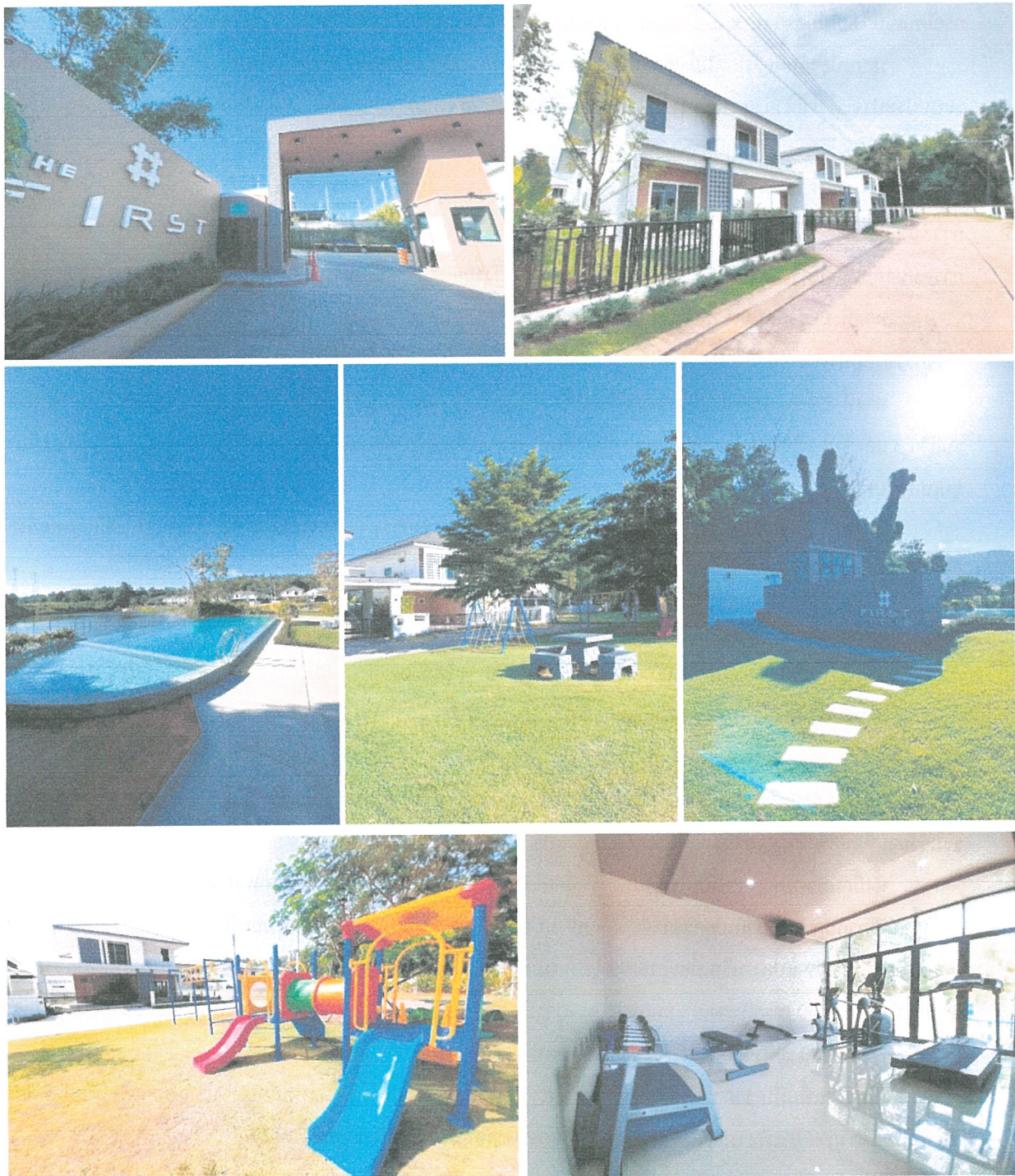
รูปภาพที่ 1.4 การใช้พื้นที่ของโครงการ